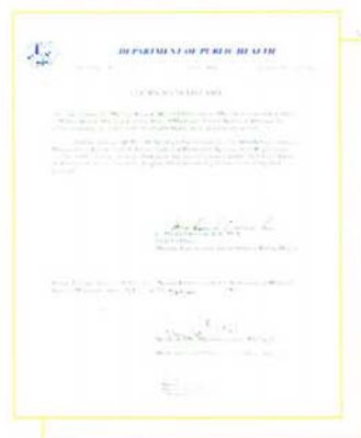
EPA Certificate, USA