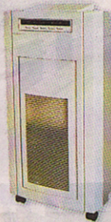
■ Inorelax 型號 300A 空氣淨化機備有負離子、紫外

據香港空氣淨化器中化技術顧問黃志峰指，空氣污染來源主要分為塵埃、氣味、有害化學物質及細菌病毒四類，最危險的殺手當然是細菌及病毒，無色無味而又觸摸不到的細菌及病毒，所以可說是都市中的隱形殺手。其實市面上大部分空氣清新機裝置數款以下不同類型的系統或濾網，用家購買時首先要了解當前面對的問題，家中的環境，然後對號入座。